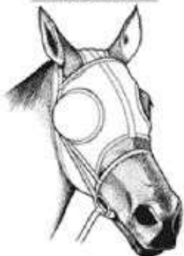
МАСКА С БЛЕНДЕРАМИ