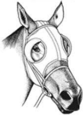
МАСКА С ШОРАМИ