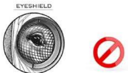
ШОРЫ С СЕТКОЙ