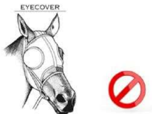
МАСКА С БЛЕНДЕРАМИ