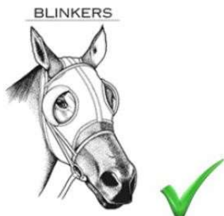
МАСКА С ШОРАМИ

Ниже приведены иллюстрации разрешенных/запрещенных шор, масок и меховушек, как описано в статьях 825.2.7, 825.2.8 и 825.3.7.